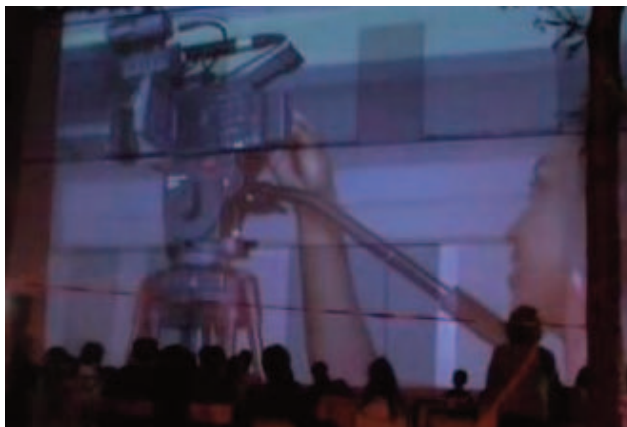
“Paroles/Visages de femmes.” Installation Vidéo 2008 de Canal Marches. Projection sur la façade du Centre social La Maison du Bas Belleville dans le cadre de la Nuit Blanche

Une action régulière de suivi, de conseil et d'échange d'expériences. Organisation d'ateliers réguliers d'évaluation et d'échange, où les projets et les réalisations en cours sont discutés collectivement, les expériences échangées horizontalement. Il s'agit d'aider les associations à imaginer, à élaborer et mettre en place leurs propres projets audiovisuels. Puis à les accompagner tout au long de leurs réalisations..